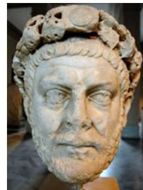
Cabeza de Diocleciano. Turkia

Parece ser, que en un primer momento fue reacio a tomar medidas violentas, entre otras cosas porque se piensa que su mujer Prisca y su hija Valeria eran cristianas. La presión de Galerio, que gobernaba en Oriente, fue decisiva para que el 23 de febrero de 303 se publicara el primer edicto de persecución.