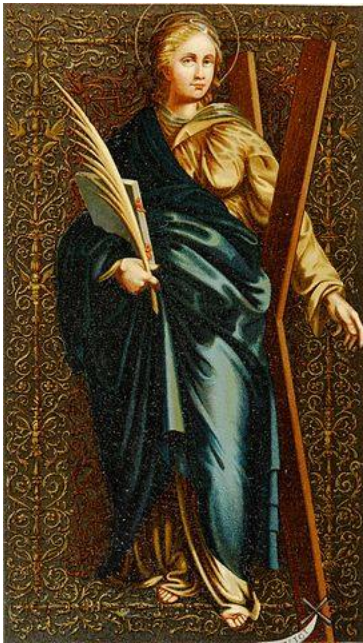
Santa Eulalia. Barcelona

Ese día se había reunido una gran multitud para celebrar en Nicomedia, (la actual Izmit de Turquía) la nueva capital del imperio de Oriente, la fiesta del dios Término, pero los cristianos de la localidad no se encontraban entre ellos, se habían reunido en otro lugar, se cree que en una Catedral cercana al palacio del emperador que habían construido y que competía en altura con él. Diocleciano y Galerio los observaban desde lo alto de dicho Palacio. A una señal los soldados asaltaron la iglesia, quemaron los libros que se encontraban en el edificio y lo destruyeron.