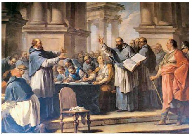
San Agustín y los donatistas

Es evidente que la Pasión apócrifa de Santa Eulalia de Mérida, escrita a finales del S, VII o principios del VIII está impregnada de las ideas Donatistas, tan es así, que colocan como instructor suyo en la fe a un tal Donato, que evidentemente como no podía ser menos en esa corriente religiosa que exacerbaba el concepto del martirio, tenía que sufrirlo. Y precisamente esta exaltación del martirio le lleva al escritor a la conclusión de que una Santa cuya devoción se había extendido por toda la cristiandad, no podía tener sino una larga lista de tormentos, trece, que mostraran todavía más la grandeza de su sacrificio. ¿Por qué trece, y no doce o catorce? ¿Se pensó en este número por azar o se encuentra algún otro significado escondido? En la Biblia los números siempre tienen un significado,[6] "Un número simbólico es aquel que no indica una cantidad, sino que expresa una idea, un mensaje distinto de él, que lo supera y lo desborda. No siempre es posible saber por qué tal número significa "tal" cosa. La asociación entre ambas realidades a veces es desconocida. Para nosotros los occidentales esto es difícil de entender, pero los semitas los usaban con toda naturalidad para transmitir ideas, mensajes o claves.