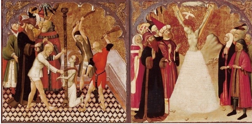
Martirios de Santa Eulalia. Barcelona

manos, fue atada a un ecúleo[7] y la dejaron caer de golpe para descoyuntarle los huesos, sufrió estiramiento de miembros para finalmente ser quemada. En otras versiones, viendo el torturador que ninguno de los suplicios surtía efecto, ya que era inocente y al parecer, eso la libraba de todo padecimiento, mandó que le cortaran la cabeza. Una vez muerta, su alma en forma de paloma salió de su cuerpo, elevándose al cielo.